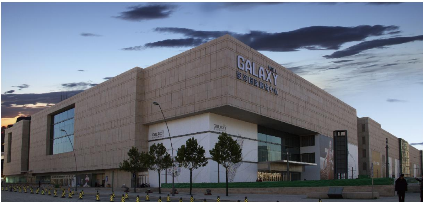
① 银河国际购物中心