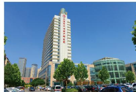
① 天津市中心妇产科医院