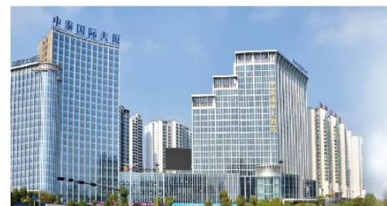
④ 河南南阳中泰国际大酒店