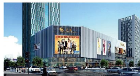
① 江苏省盐城金鹰广场