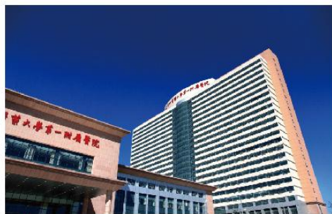
① 天津中医药大学第一附属医院