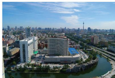
① 天津市第一中心医院