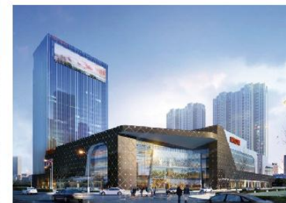
① 南京茂业天地广场