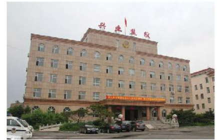
④ 吉林省长春兴业监狱